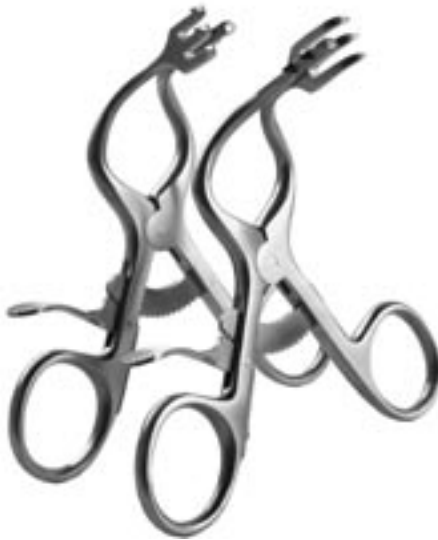
tk 56770-00W tk 56769-00W

This fine clip is very well suited for holding the ossicle, which is ground to shape as a stapes elevation or columella. The „lock“ helps to prevent the transplant from jumping off.