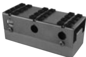
Bohrständer für 24 Bohrer Drillcarrier for 24pcs. tk 56795-00W

Andere Modelle und Längen sowie Imperatorbohrer auf Anfragen erhältlich Other models and lengths as well as imperator drills on request