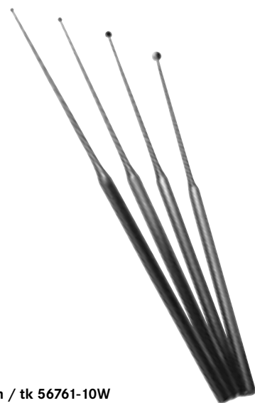
1.0mm / tk 56761-10W 1.5mm / tk 56762-15W 2.5mm / tk 56763-25W 4.0mm / tk 56764-40W

Besides the standard round knife with a 45-degree bend, the bending of the disc knife by 25 degrees has proven very effective in endaural surgery due to the fact of passing through the auditory canal associated with a changed angle of view and direction of work, which is steeper in comparison with the retroauricular approach.